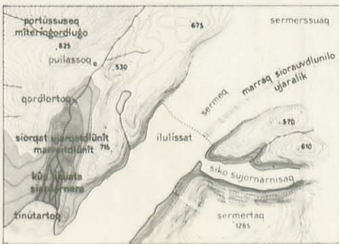
0-200m Lavland nunap pukinera Lowland